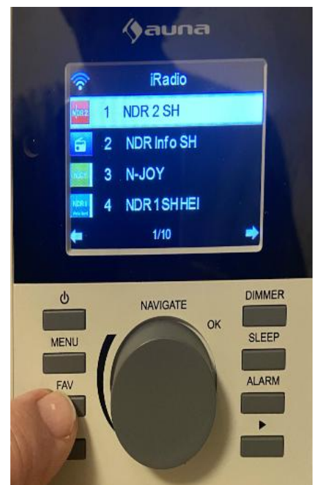
Bedienfeld des Internetradios

Falls sich das Internet-Radio (leider) einmal aufgehängt, ziehen Sie bitte den Netzstecker und stecken ihn nach ca. 3 Sekunden wieder ein. Das Radio verbindet sich automatisch neu mit dem WLAN des Ferienhauses Back und sollte dann wieder den letzten eingestellten Sender empfangen.