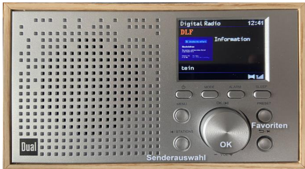
Dual Radio mit DAB+

Zur Senderauswahl drücken Sie auf den Knopf „Stations“ und drehen Sie den großen Knopf in der Mitte bis zur gewünschten Radiostation. Drücken Sie dann den Drehknopf „OK“ leicht nach hinten zur Aktivierung der Auswahl. Die gängigen Sender finden Sie, wenn Sie den Knopf „PRESET“ für die Favoriten drücken. Auch hier muss man die Station mit dem Drehrad anwählen und mit einem Druck auf „OK“ aktivieren.