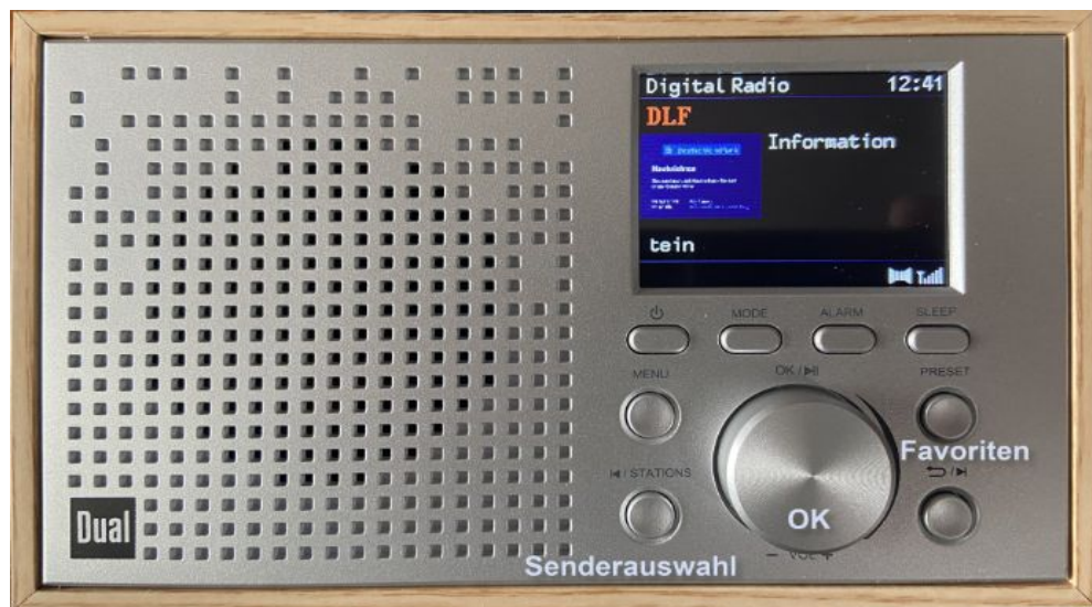
Dual Radio mit DAB+

Falls sich in der Wohnung ein Internet-Radio befindet, drücken Sie auf „FAV“ für die Favoriten-Sender, um aus einer Vorauswahl von Sendern auszuwählen. Der große, runde Knopf („Navigate“) erlaubt das Scrollen nach oben und unten in der Liste. Mit einem Druck auf den großen Knopf wird der aktuelle Sender ausgewählt.