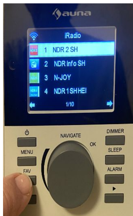
Bedienfeld des Internetradios

Falls sich das Internet-Radio (leider) einmal aufgehängt, ziehen Sie bitte den Netzstecker und stecken ihn nach ca. 3 Sekunden wieder ein. Das Radio verbindet sich automatisch neu mit dem WLAN des Ferienhauses Back und sollte dann wieder den letzten eingestellten Sender empfangen.