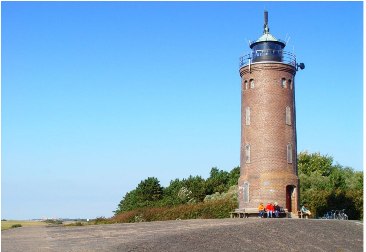
Leuchtturm St. Peter-Böhl